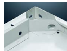
META 230 bzw. 330 kg Fachboden