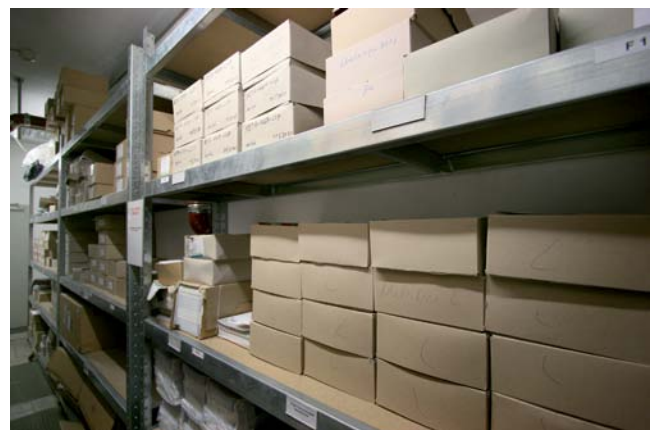
... als Kataloglager auf engstem Raum oder als praktischer Packtisch im Versand