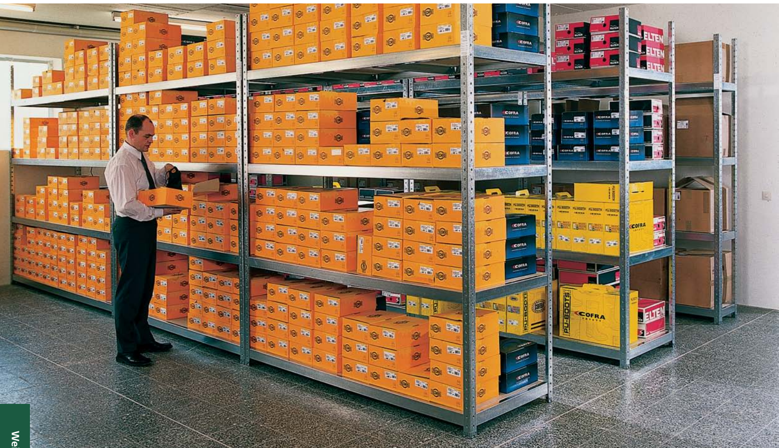
META SPEED-RACK® Weitspannregal – vielseitig einsetzbar, ob als Schuhlager, ...